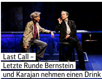
Last Call - Letzte Runde Bernstein und Karajan nehmen einen Drink