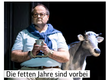
Die fetten Jahre sind vorbei