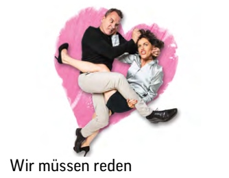
Wir müssen reden