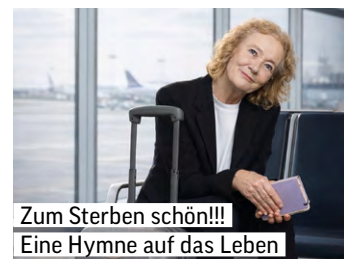
Zum Sterben schön!!! Eine Hymne auf das Leben