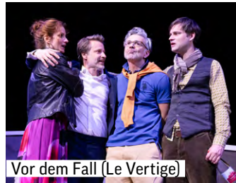
Vor dem Fall (Le Vertige)