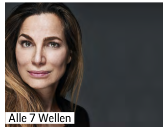
Alle 7 Wellen