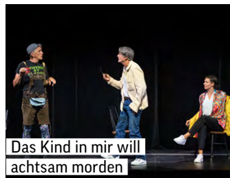
Das Kind in mir will achtsam morden