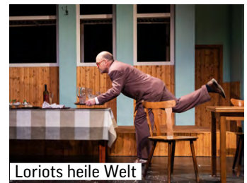
Loriots heile Welt