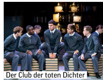
Der Club der toten Dichter