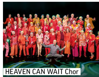
HEAVEN CAN WAIT Chor