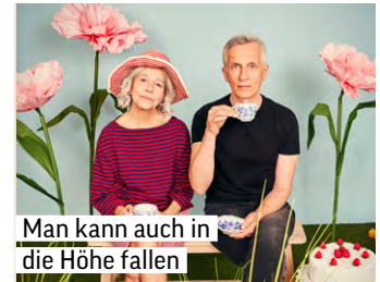
Man kann auch in die Höhe fallen