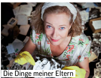
Die Dinge meiner Eltern