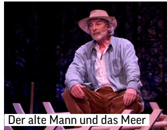
Der alte Mann und das Meer