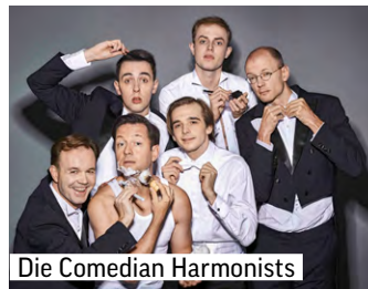
Die Comedian Harmonists