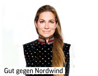
Gut gegen Nordwind